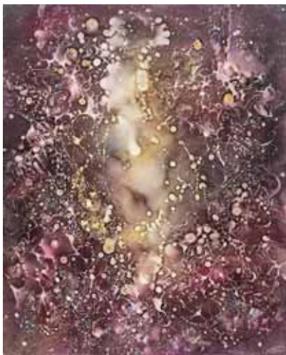
VÍZ, FÉNY, HÍNÁR