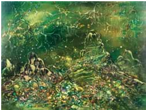
SMARAGD BARLANG I.