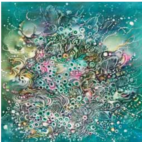
TENGER MÉLYÉN I.