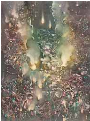
A FÉNY MEGSZILÁRDULÁSA