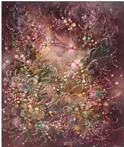
KAGYLÓK, GYÖNGYÖK, VIRÁGOK