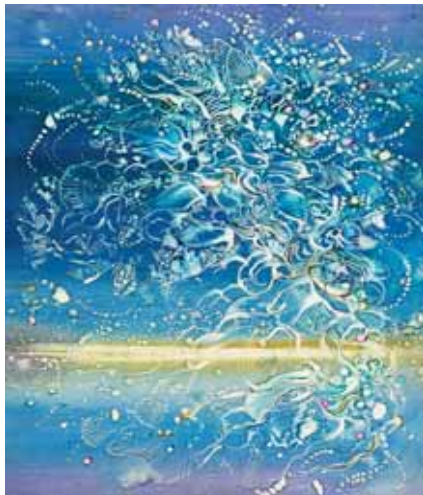
ÖRVÉNYLÉS VÍZ FELETT