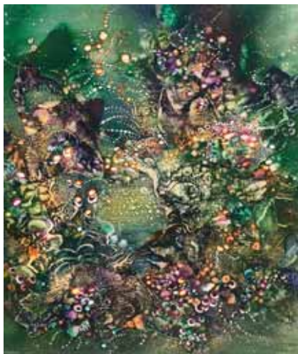
TENGER MÉLYÉN II.