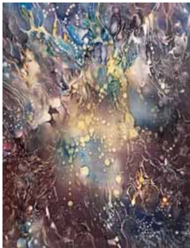
FÉNYEK A BARLANGBAN III.