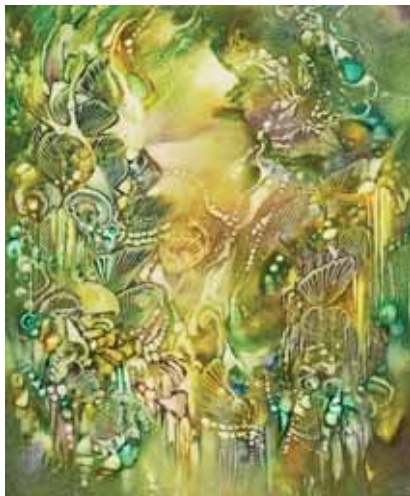
FÉNY AZ ESŐERDŐBEN