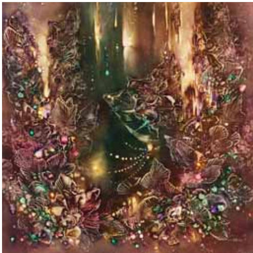
FÉNYEK A BARLANGBAN I.