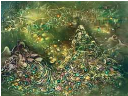
SMARAGD BARLANG II.