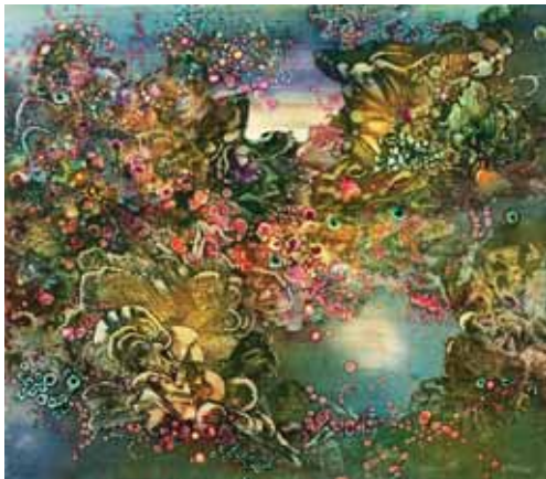
KAGYLÓK ÉS VIRÁGOK