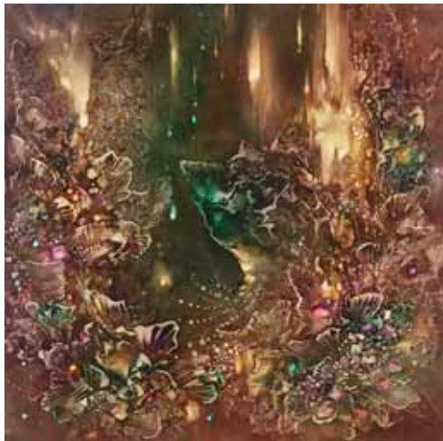
FÉNYEK A BARLANGBAN II.